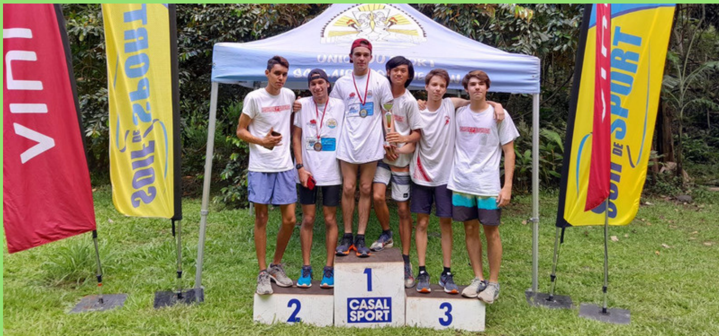
VAINQUEUR EQUIPE JS GARÇONS