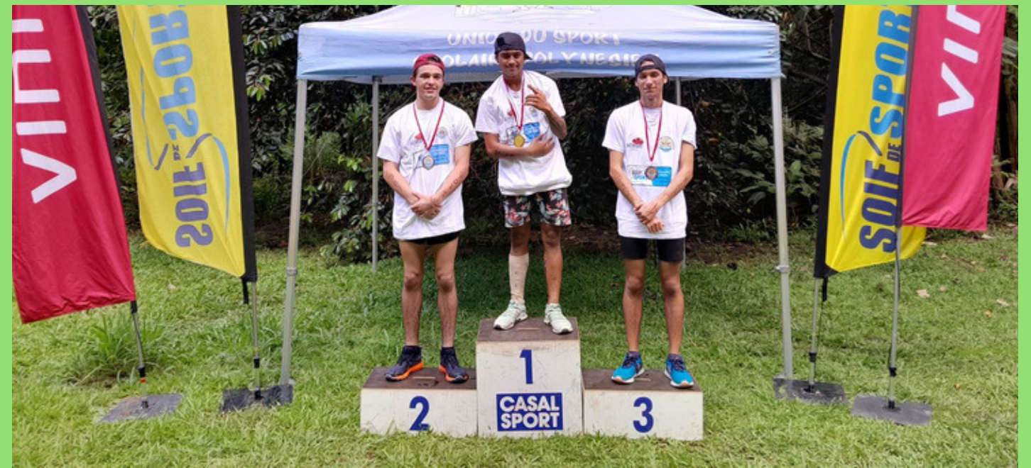
PODIUM JS GARÇONS