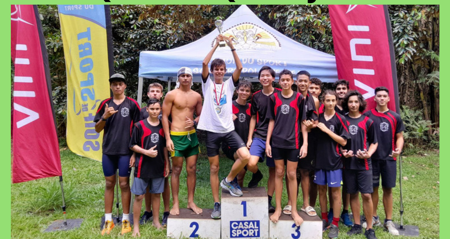
VAINQUEUR EQUIPE CADETS