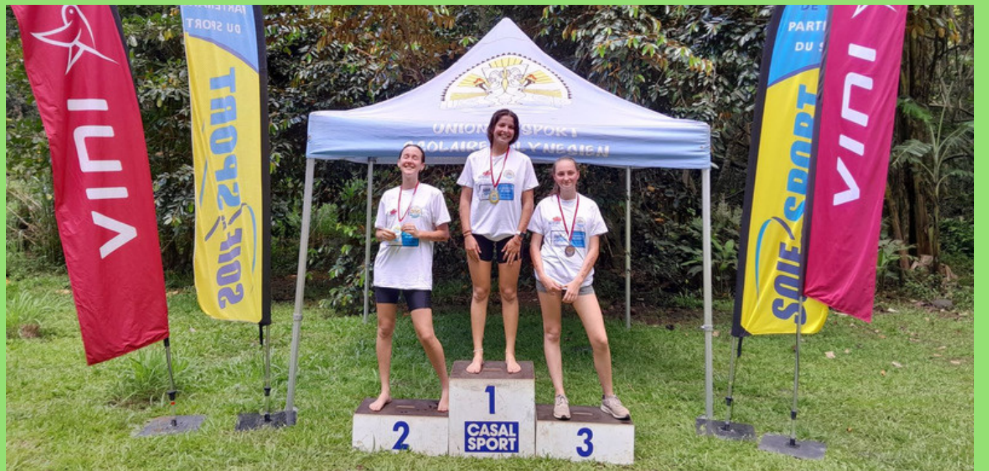
PODIUM JS FILLES