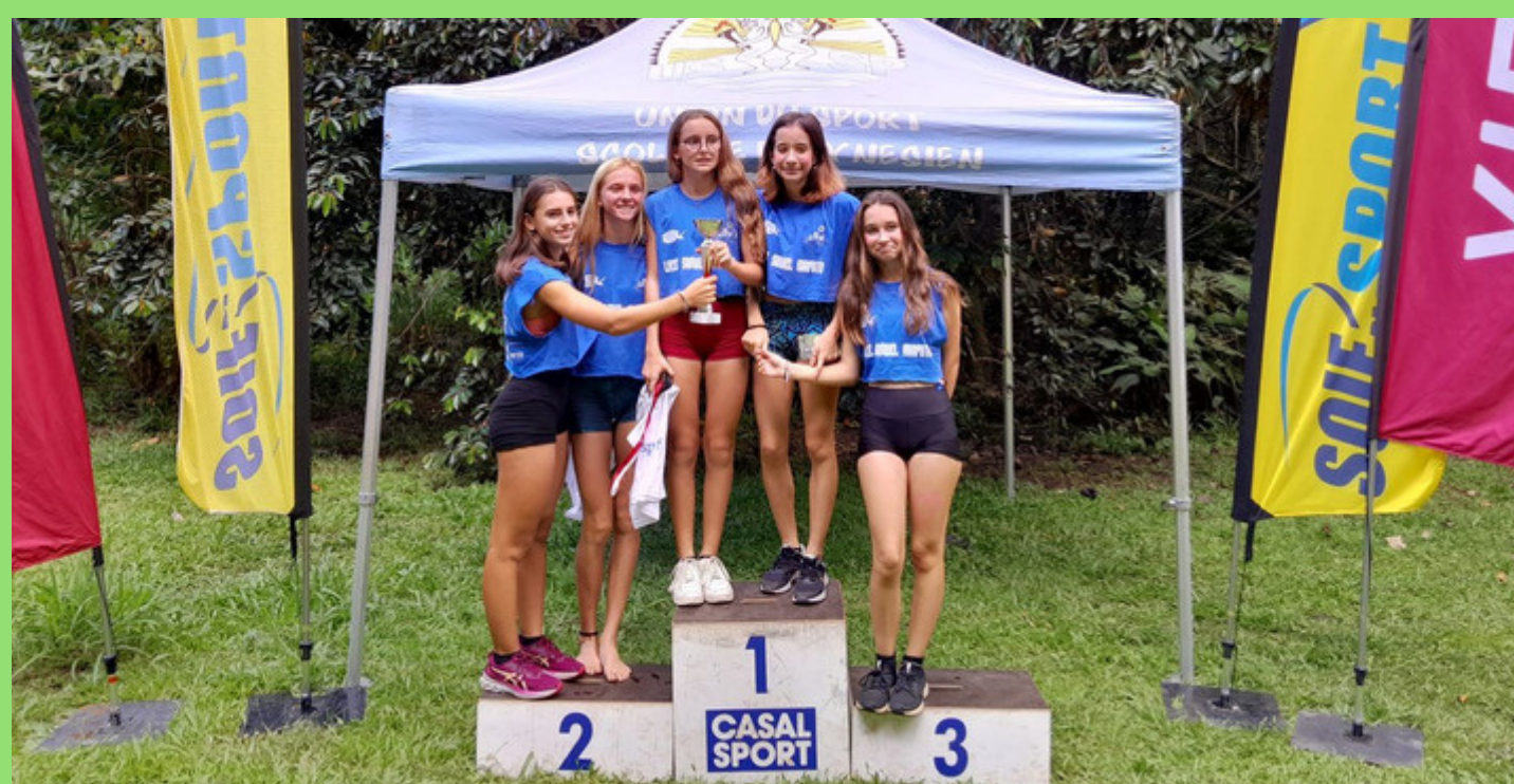
VAINQUEUR EQUIPE CADETTES