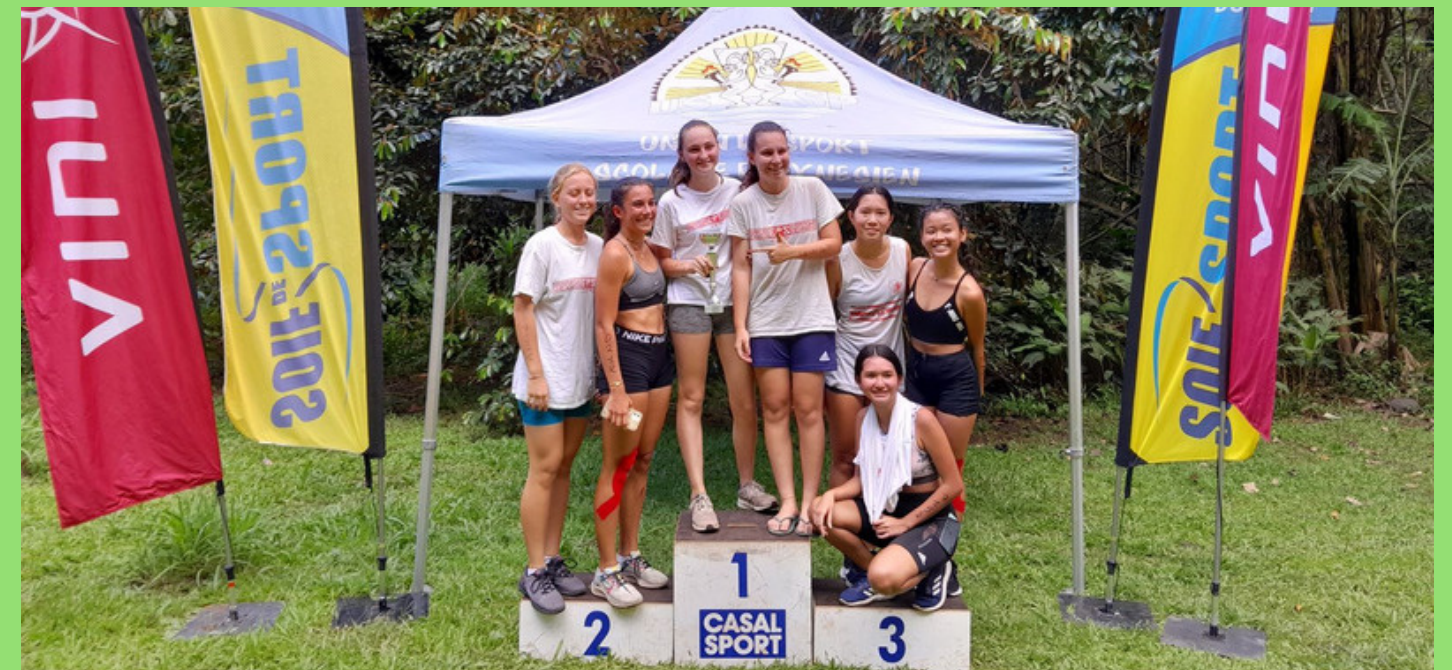
VAINQUEUR EQUIPE JS FILLES